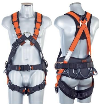
Power & Comfort