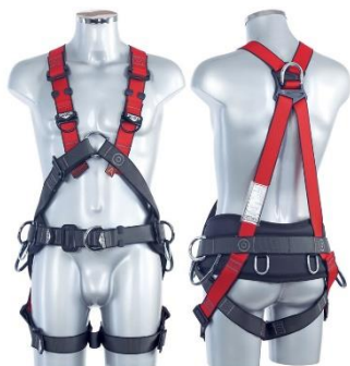
Classic / Classic-Automatic