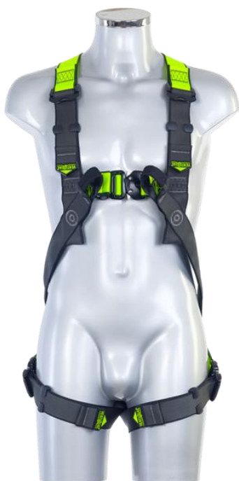
V3 ENTERPRISE Automatic